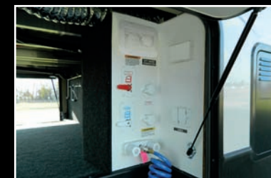
Centre de commodité avec système d'hivernisation, soupape de dérivation du chauffe-eau et système de rinçage du réservoir des eaux noires