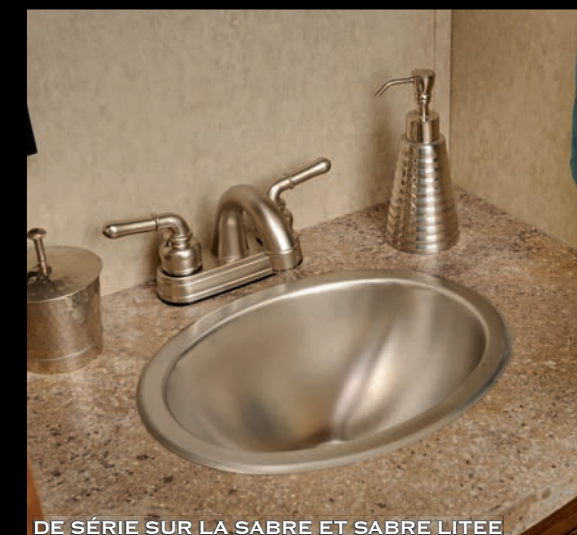
DE SÉRIE SUR LA SABRE ET SABRE LITEE