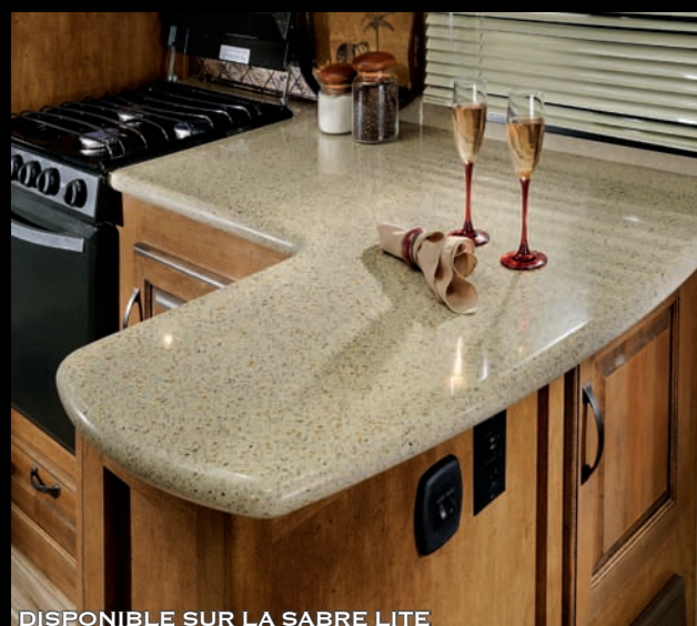
DISPONIBLE SUR LA SABRE LITE