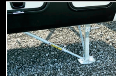
Bras de stabilisation JT Strong de série (Sabre seulement)