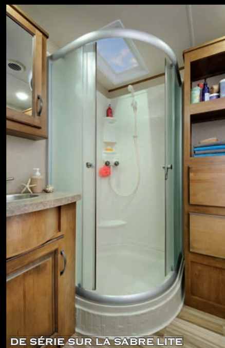
DE SÉRIE SUR LA SABRE LITE