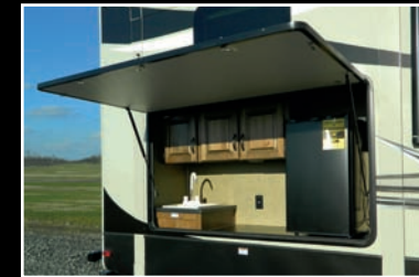
Cuisine extérieure équipée d'un réfrigérateur et évier dans un compartiment avec porte à loquet à ressort