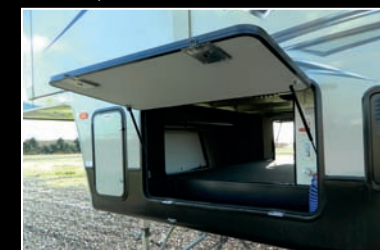
Le leader de l'industrie pour son coffre de rangement pleine largeur et sans obstruction