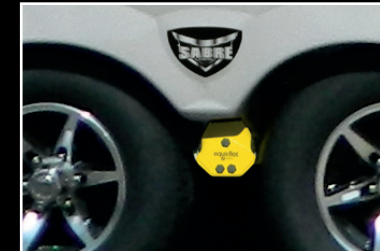
Suspension supérieure EQUA FLEX qui augmente la stabilité verticale et adoucit le remorquage