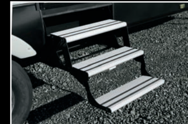
Marchepied en aluminium avec marche "Tread Lite" pour faciliter l'entrée et la sécurité