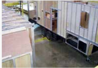
Célèbre superstructure toute en aluminium de Cedar Creek (toit, murs latéraux et plancher) centrée aux 16" ou moins