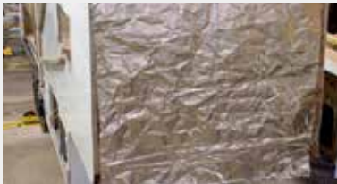
La barrière radiante Therma-foil radiante R-38 passe à travers les plafonds, les dessous d'unités et sous les caps avant.