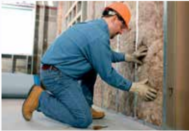
Laine de verre isolante de style résidentiel, conçue par la nature