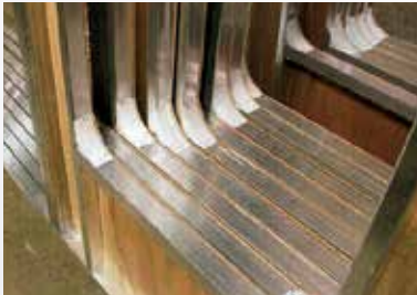
Châssis des fenêtres en aluminium