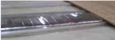
Chevron en aluminium de 3" au plancher avec canalisations de chauffage et contreplaqué de 5/8" emboîté