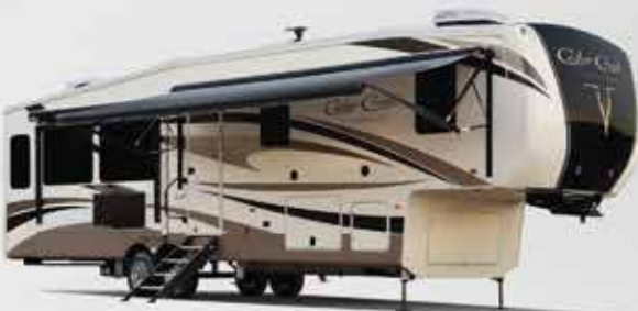
Les extérieurs et murs d'extrémité sont en fibre de verre "True Nobel" gélifiée. Vraiment le meilleur des meilleurs en fibre de verre. N'acceptez pas les imitations.