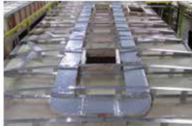
Système de climatisation de 15 000 BTU haute performance Quiet Zone™ avec système de canalisation de style résidentiel qui retourne l'air et un centre de commande pour le confort : voici ce qui crée une combinaison dynamique qui donne de très bons résultats. C'est le système de climatisation le plus puissant existant avec l'A/C le plus performant de l'industrie et le moins énergivore de l'industrie, avec un 2e A/C disponible dans la chambre en plus!