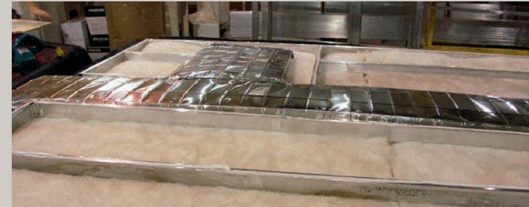
Solives de plancher en aluminium 2" x 3"