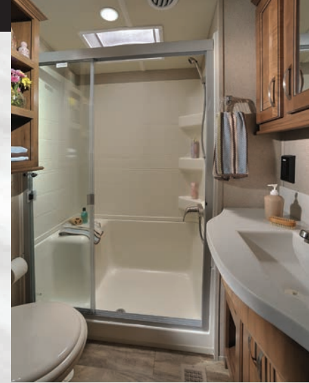
La luxueuse salle de bain de Silverback comprend une large douche de 48" et porte en verre avec siège, une toilette en porcelaine et un ventilateur Fantastic avec interrupteur au mur.