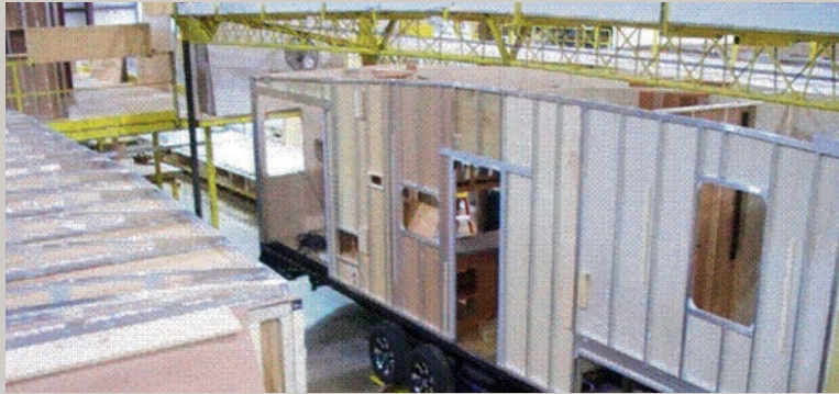
Murs latéraux et charpentes de toit en aluminium centrés aux 16" ou moins