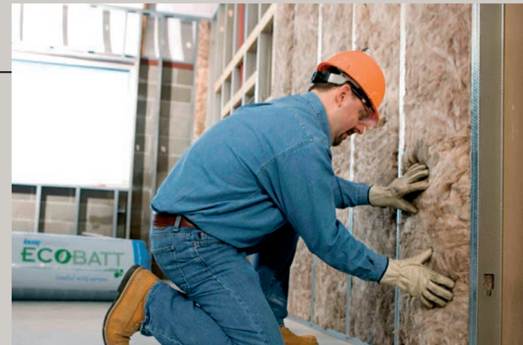
Laine de verre isolante de style résidentiel, conçue par la nature