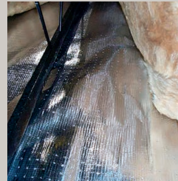
Protection radiante Therma-foil -R-38 dans le plafond, en dessous et en avant de l'unité.