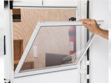
Contre-portes en vinyle amovible "Soft Top" qui permettent un éclairage naturel et la visibilité, sans perte de chaleur ou d'air frais.