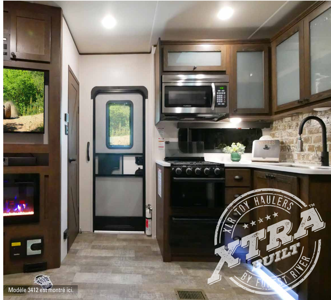
Modèle 3412 est montré ici.