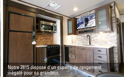
Notre 2815 dispose d'un espace de rangement inégalé pour sa grandeur.