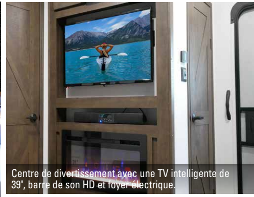
Centre de divertissement avec une TV intelligente de 39", barre de son HD et foyer électrique.