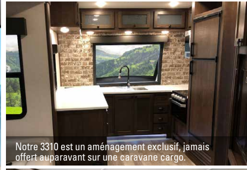
Notre 3310 est un aménagement exclusif, jamais offert auparavant sur une caravane cargo.