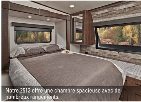
Notre 2513 offre une chambre spacieuse avec de nombreux rangements.