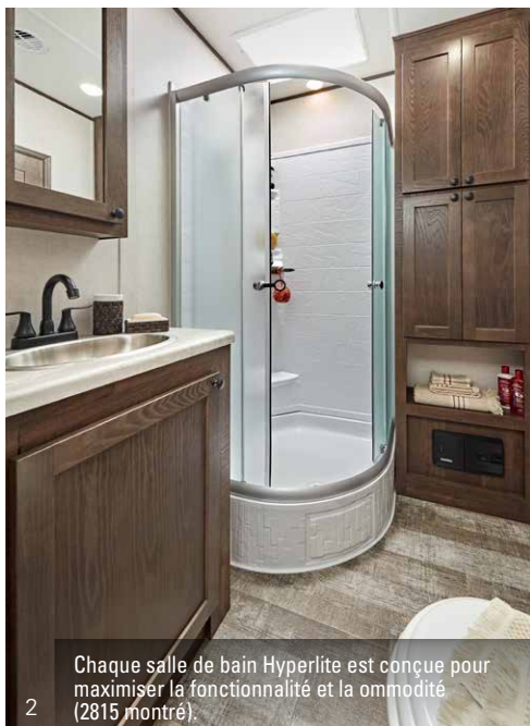
Chaque salle de bain Hyperlite est conçue pour maximiser la fonctionnalité et la commodité (2815 montré).