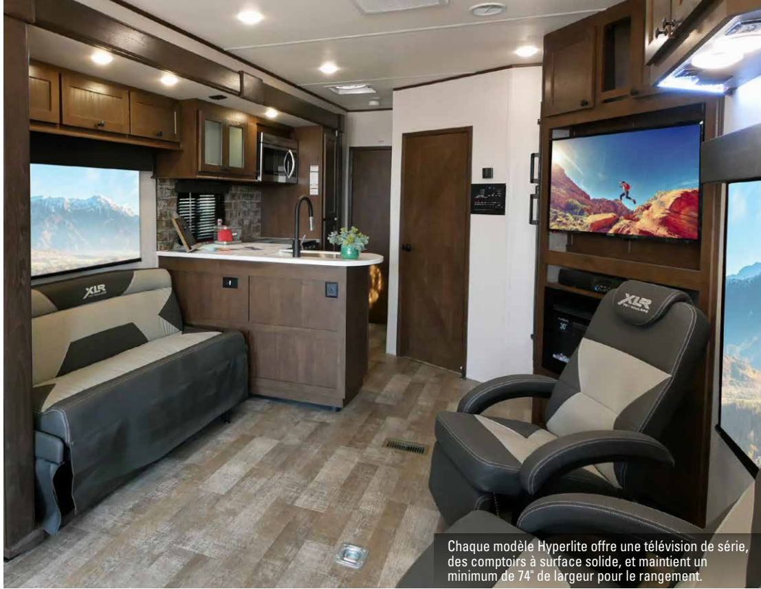
Chaque modèle Hyperlite offre une télévision de série, des comptoirs à surface solide, et maintient un minimum de 74" de largeur pour le rangement.

Le décor à la fois rustique et moderne de l'Hyperlite vous fait vous sentir chez vous même lorsque vous partez en exploration. Un style personnalisé et des caractéristiques de qualité sont réunis dans ce modèle léger. Les véhicules de remorquage d'aujourd'hui peuvent en faire plus et l'Hyperlite vous en donne certainement plus.