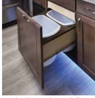
Armoire avec deux poubelles (40CCK, 40CRS seulement)