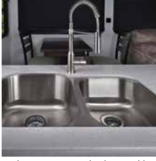
Le nettoyage est simple et rapide grâce aux éviers encastrés en acier inoxydable et ce robinet coulissant à poignée unique avec pulvérisateur.