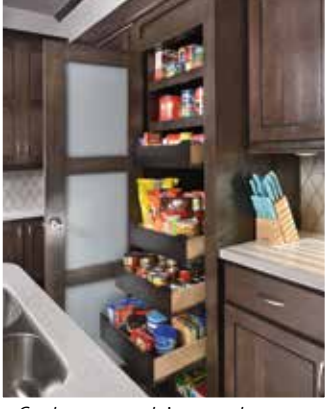
Garde-manger pleine grandeur avec tiroirs et tablettes pleines extension