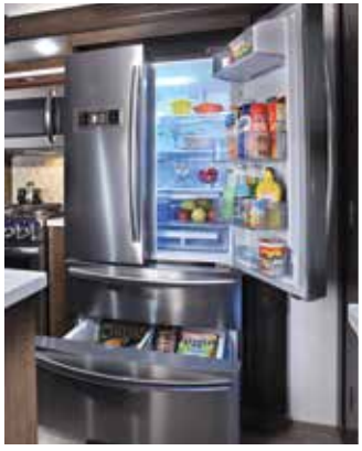
Réfrigérateur de 20 pi.cu. en acier inoxydable de style résidentiel avec machine à glaçons et onduleur dédié.