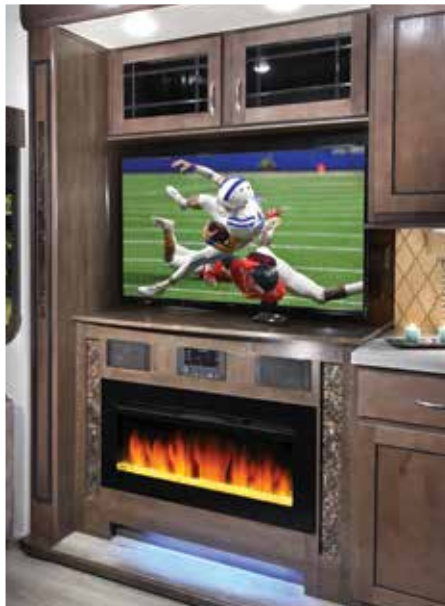
Les TV de nos centre de divertissement ont tous un support pivotant qui permet un visionnement optimal de partout dans l'unité.