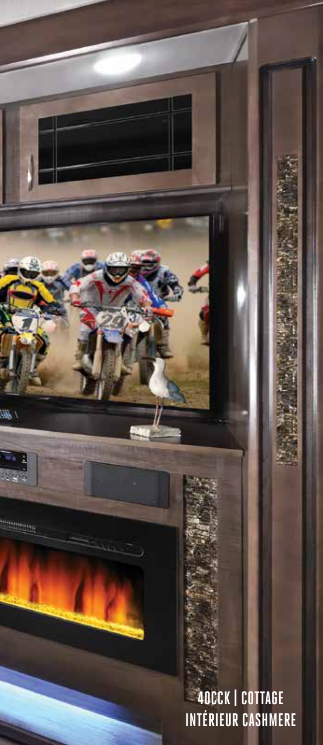
40CCK | COTTAGE INTÉRIEUR CASHMERE