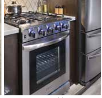
Four au gaz de 24" de style résidentiel