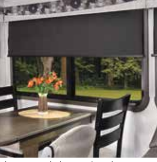
Les stores de jour et de nuit peuvent être réglés dans n'importe quelle position et sont conçus avec des contrôles de vitesse et de longueur garantissant l'intimité ou une vue panoramique.