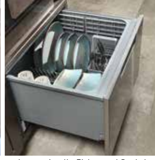
Lave-vaisselle Fisher and Paykel en inox est en option sur des modèles spécifiques