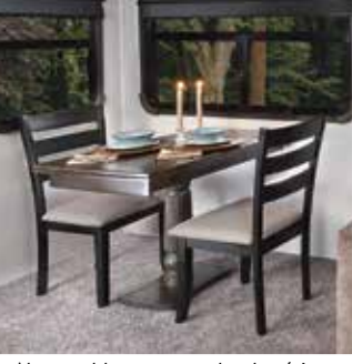
Notre table sans attache de série vient avec une grande extension et quatre chaises.